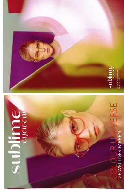
Cover + Backcover: Eyemax by Koberg & Tente

Alle Artikel und Shootings finden Sie auch auf der Sublime Eyewear-Website