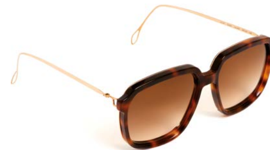
Haffmans & Neumeister